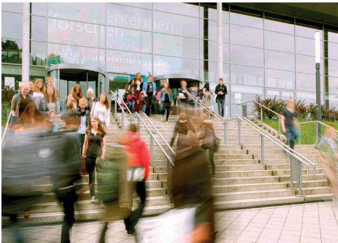
Stand: 03.2023

Internationale Kongresse, die regelmäßig in Lübeck stattfinden, sorgen frühzeitig für den Austausch zwischen Wissenschaftlern und begeisterungsfähigen Studierenden. Die Erstsemesterbegrüßung, der Hochschulball und die Zeugnisübergabe gliedern das Jahr und sind Höhepunkte für unsere Studierenden.